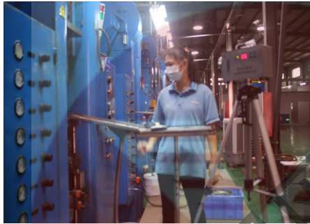
现场定点有机物采样