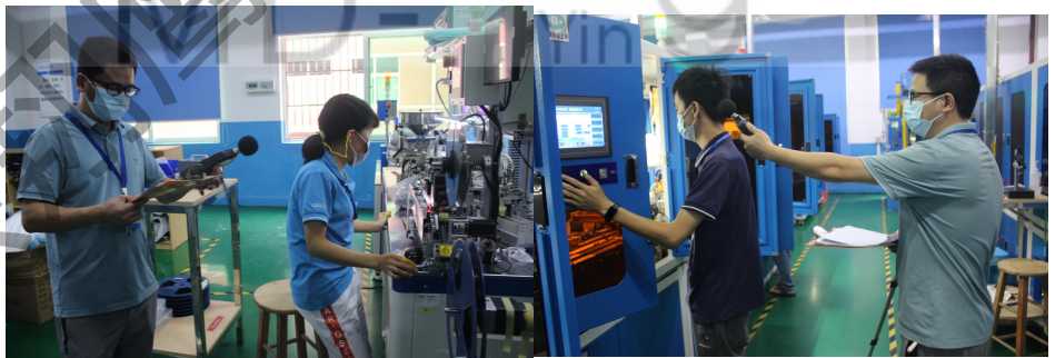
现场定点噪声测量