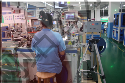
现场定点粉尘采样