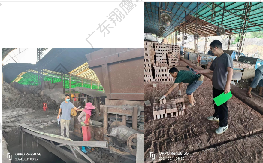
现场定点噪声测量