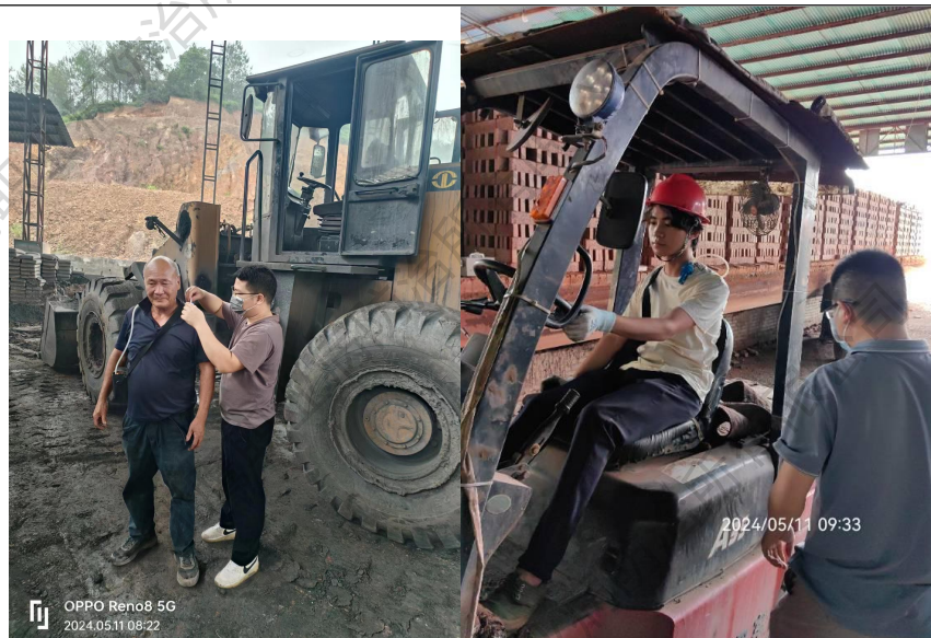
现场个体粉尘采样